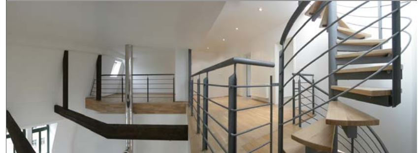
Galerieebene im Dachgeschoss, eine Spindeltreppe führt zur Dachterrasse mit exponiertem Blick über Plagwitz